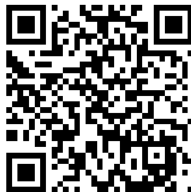
【就學貸款訊息公告網頁】